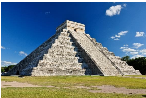
Un temple Maya au Mexique...

Nous avons observé dans le paysage et lors de ses visites dans les musées, que ces lignes se retrouvent souvent !