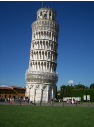
La tour de Pise en Italie