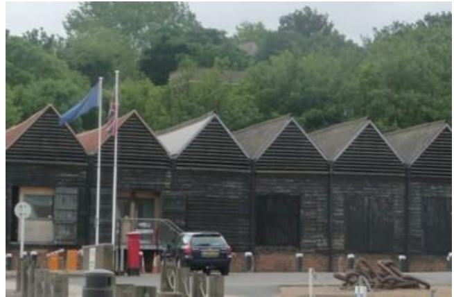
Les entrepôts de Chatham en Angleterre